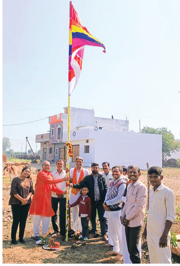
हरिभूमि न्यूज | नलखेड़ा

आगामी 25 जनवरी से होने वाले नव कुंडात्मक रुद्र यज्ञ एवं सप्त दिवसीय संगीतमय महाशिवपुराण कथा के लिए शुक्रवार को मकर संक्रांति के पर्व पर श्रद्धालुओं ने श्री योगेश्वर महादेव मंदिर प्रांगण पर इंद्रध्वज का पूजन कर ध्वजारोहण किया गया। स्मरण रहे एक वर्ष पूर्व श्री योगेश्वर महादेव के नवनिर्मित मंदिर पर शिव परिवार की प्राण प्रतिष्ठा की गई थी। जानकारी देते हुए आयोजन समिति के सदस्य