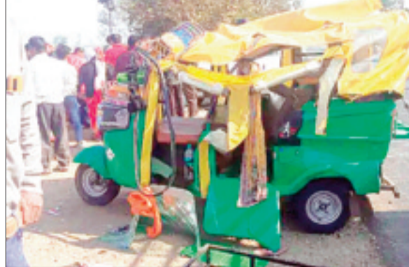
हरिभूमि न्यूज | सीहोर

भोपाल-इंदौर मार्ग पर कुबेरेश्वर धाम के पास बुधवार सुबह पिकअप की टक्कर से ऑटो में सवार 7 सवारियां घायल हो गई हैं। हादसे के बाद घायलों को उपचार के लिए नजदीकी अस्पताल में भेजा गया है। बताया गया है कि इस सड़क हादसे में ऑटो काफ़ी क्षतिग्रस्त हो गया है। ऑटो की हालत देखकर ही अंदाजा लगाया जा सकता है की टक्कर